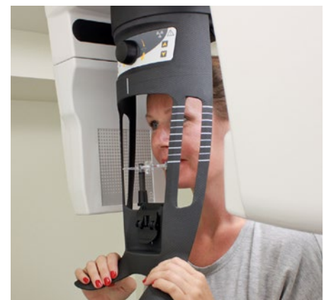
Panorama CBCT-röntgen med kefalostat.