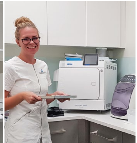
Sterilen med Melag Vacuclav 40B+ Evolution och iCare+.