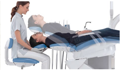
Steglöst reglerbar stol.