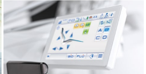
7" Full touch kontrollpanel med gyro-funktion.