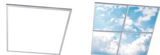
D-tec Ledplatta 60x60

Skapar en lugnande effekt, kan med fördel användas i t.ex. taket i väntrum.