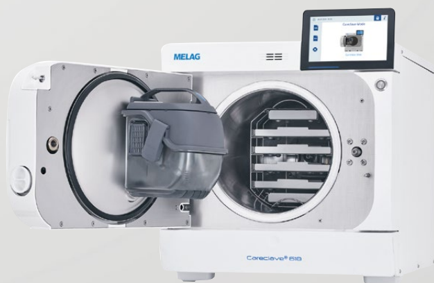
Melag Careclave 4+1

Autoklav, diskdesinfektor, smörjutröstning och dokumentering.