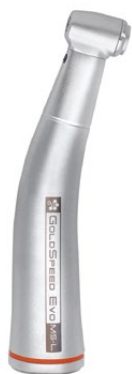
Evo M5-L LED-ljus Uppväxlat 1:5

Silent Power Evo Smidiga och tysta med hög prestanda.