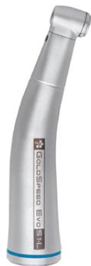
Evo S1-L LED-ljus Direktväxlat 1:1