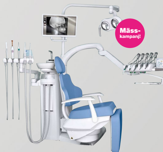
Stern Weber 380TRC

Autoklav, diskdesinfektor, smörjutröstning och dokumentering.